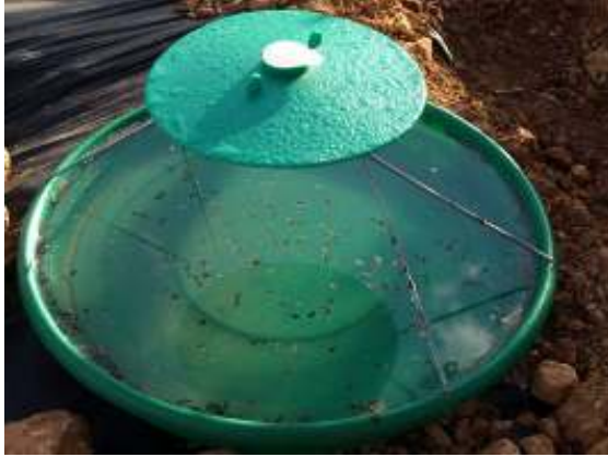
מלכודת ללכידה המונית