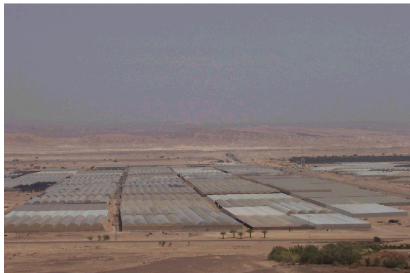
אזור החממות בפארן