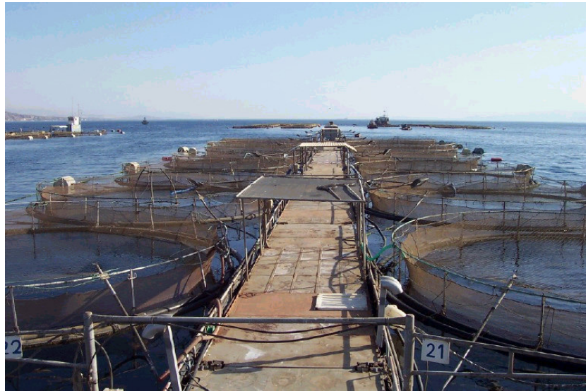
כלובי הדגים באילת

לאור הנתונים קיבלה ועדת הפרוגרמות את הבקשה ב1.3.06 והמליצה לשר החקלאות להגדיל את מספר הנחלות בקיבוץ יוטבתה ל- 150 נחלות ועפ"י 40 דונם ו-51 אלף קוב מים לנחלה. ככל שיתקדם האכלוס בישובים האחרים בדרום הערבה תידון בקשתם להגדלת תקני הקרקע והמים בכפוף לאכלוס ובהתאם לנ"ל.