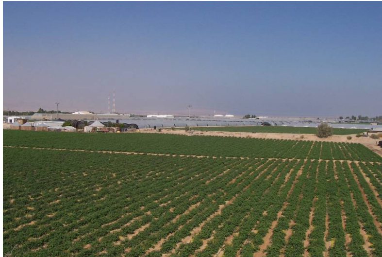
חקלאות בשטח פתוח ובחממות בכיכר סדום

בהתייחס לטענה המועלית בעבודה של החברה להגנת הטבע בדבר הפגיעה האפשרית של החלטות ועדת הפרוגרמות בשטחי הנגב, והאיום לשמירת הטבע והנוף הטמון בהקצאת שטחי חקלאות והרחבת העיבוד החקלאי בנגב; מובאת כאן סקירה מתומצתת של היקף השטחים המוגנים בנגב.