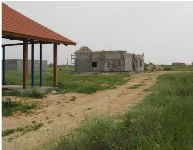
בנייה חדשה בתלמי יוסף – מרץ 2008

עיקרה של תנופת הקליטה התבצעה בין 2005 ל-2007. תוספת המשפחות מוצאת את ביטוייה בקליטת משפחות צעירות בישוב והצערותו באופן הזה, בבנייה ובפיתוח רחובות חדשים וחלקות חדשות.