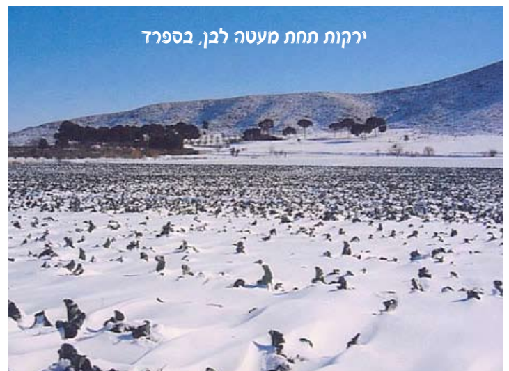
ירקות תחת מעטה לבן, בספרד

מקורות: Freshplaza.com 18.12.2009, 22.12.2009 Greenmed.eu